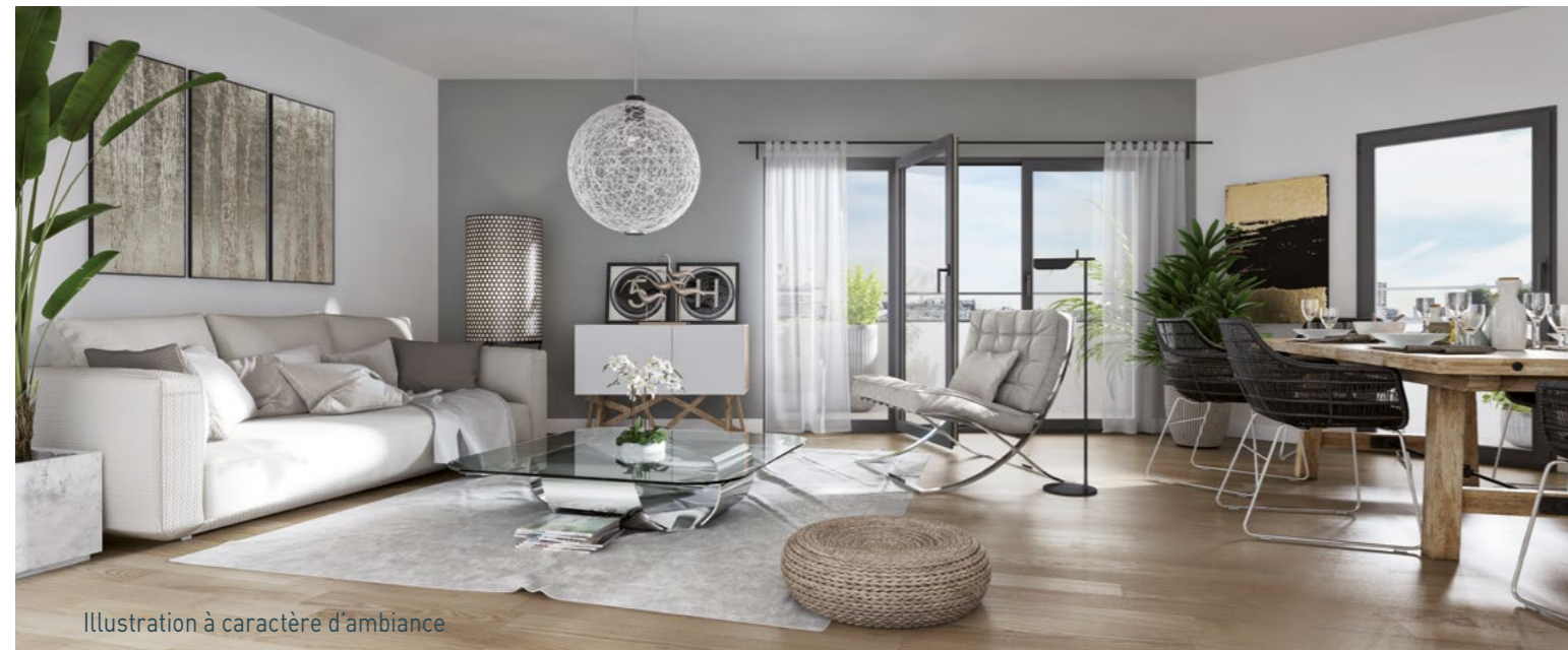
Illustration à caractère d'ambiance