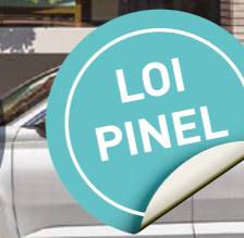
Vue depuis la rue Roger Salengro